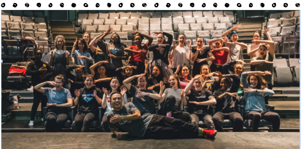
Photo Compagnie Red Sky Performance / élèves de l'école Père-Marquette © Salomé Boniface.

Quelques pistes pour apprécier la danse contemporaine par Fabienne Cabado, médiatrice culturelle